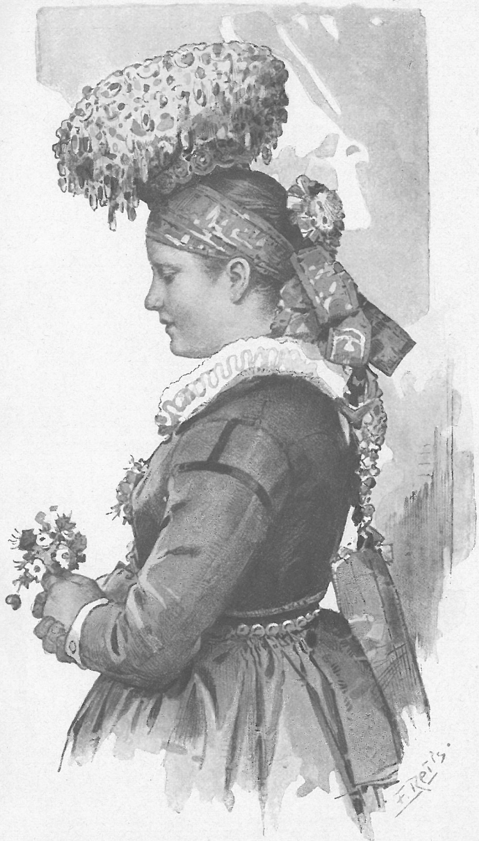
Mädchen aus dem Gutachthale im Brautschmuck. Nach einem Aquarell von Fritz Reif.