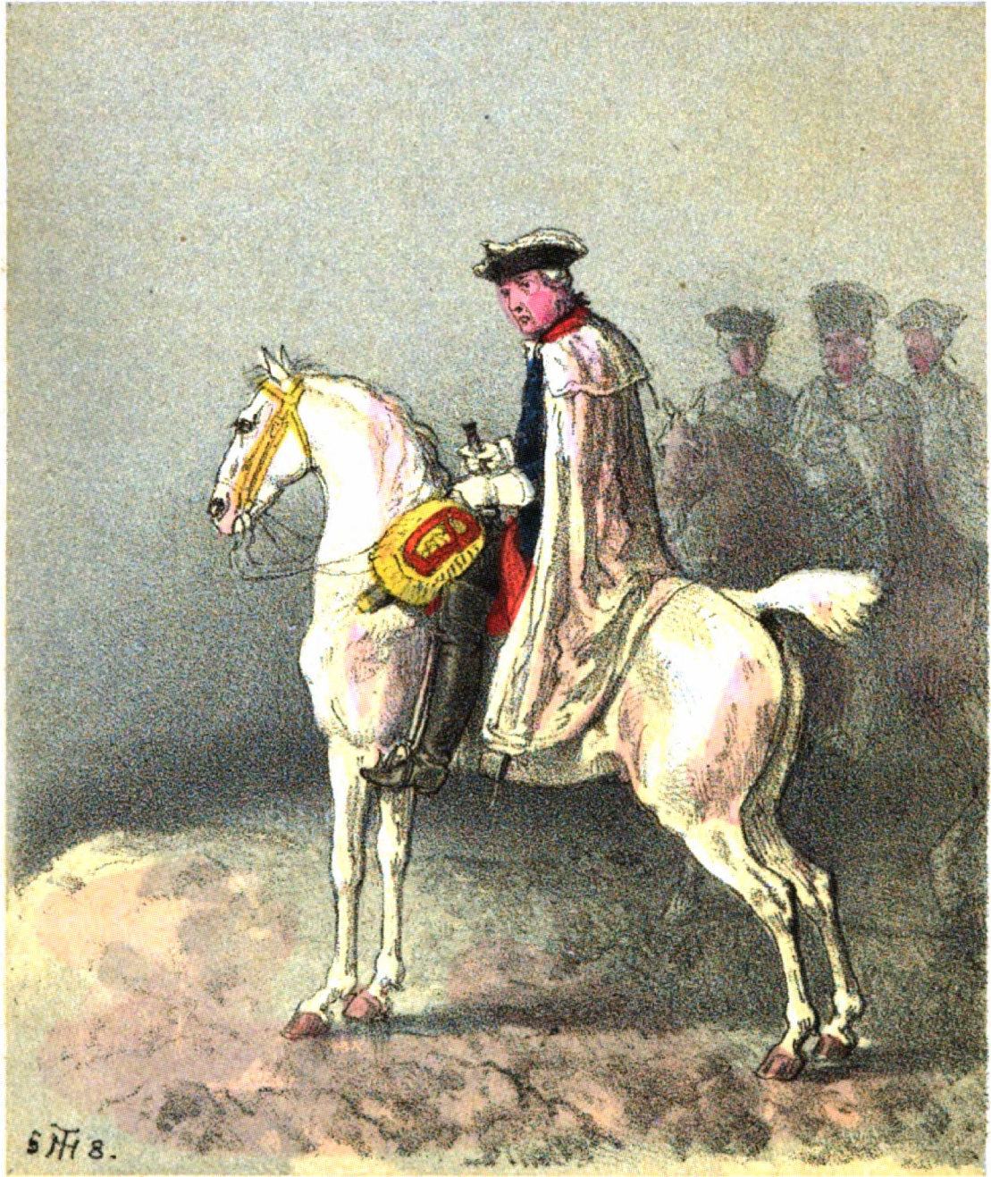
Vor der Schlacht bei Leuthen.