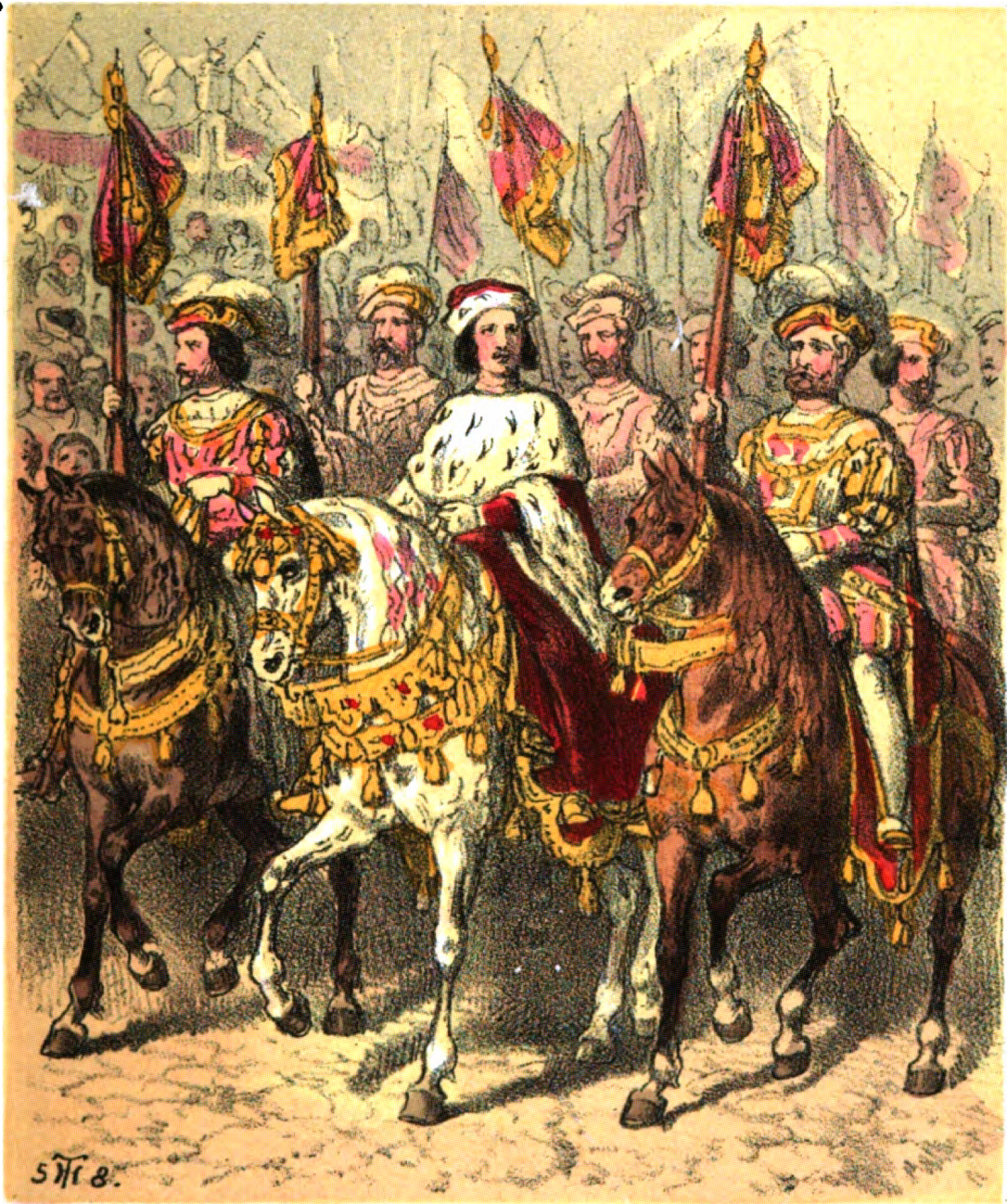
Burggraf Friedrich von Nürnberg.