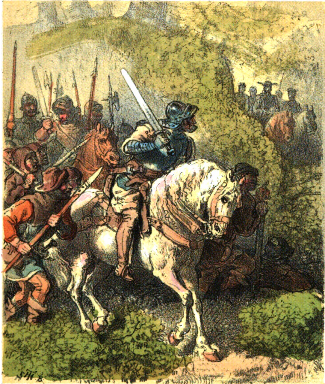
Erzbischof Engelbert von Köln.