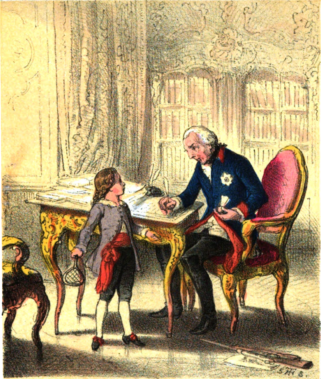
Friedrich Wilhelm III.