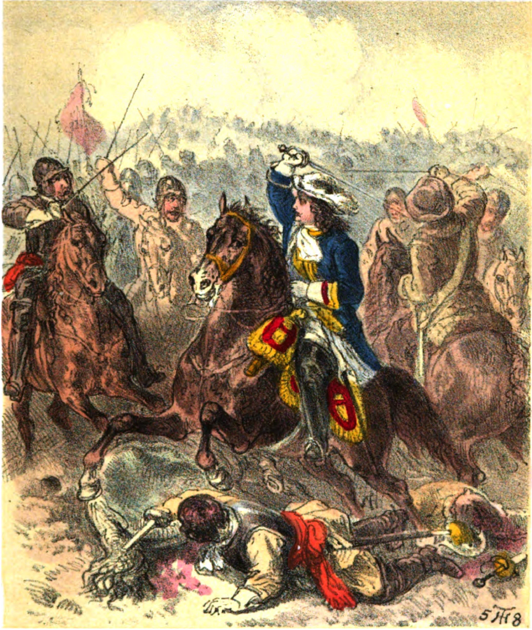
Schlacht bei Fehrbellin.